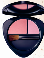
Blush Duo 02