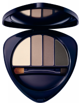
Eye & Brow Palette